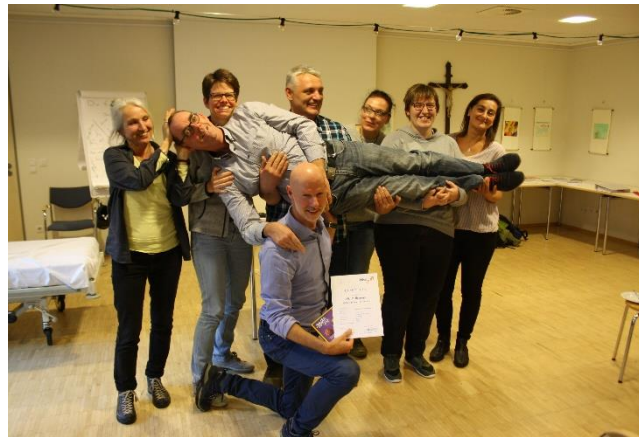
De deelnemers van de der Implementatiecursus

Volgend jaar organiseert de K-Plus Gruppe in Solingen (DE) nog een Niveb-Kinaesthetics Implementeringscursus. Start: 17 september 2019.